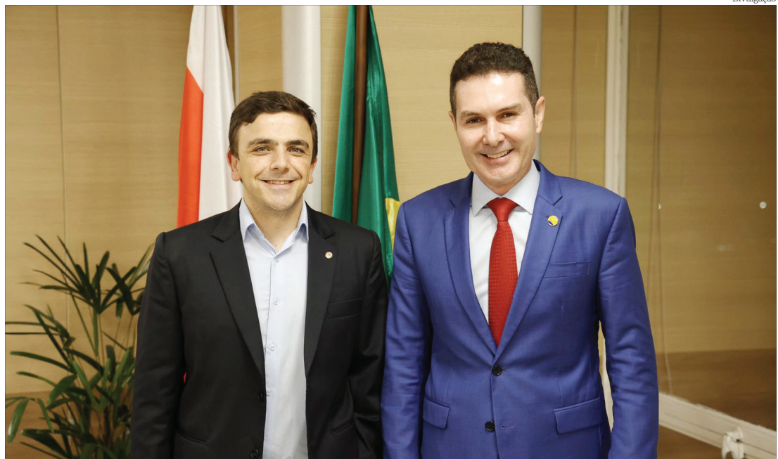
Deputado federal Aliel Machado (PV), durante anúncio liderado pelo Ministro das Cidades, Jader Filho

No âmbito do MCMV Rural, mais de 75 mil moradias foram selecionadas, representando um aumento de