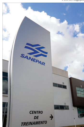
Valores cobrados pelos serviços terão um acréscimo de 2,95% e serão válidos a partir de maio

O reajuste anual foi calculado com base em metodologia aprovada pelo Conselho Diretor da Agepar, que permite uma evolução de preços mais próxima à inflação. Neste ano,