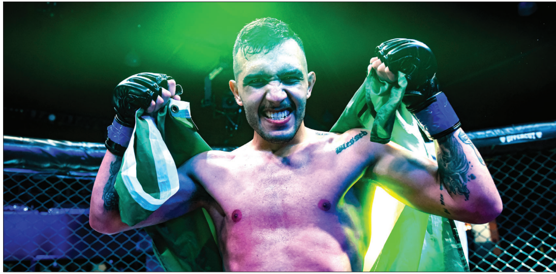
Zenidim é o atual campeão do 'Peso Galo' do HFC, com um recorde de 14 vitórias e apenas duas derrotas

De acordo com o lutador, a preparação para o confronto está na reta final. "Nesta última semana es-